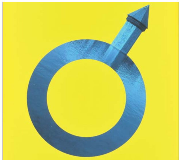
Luzern im Zeichen des Mannes. Das «Männerpalaver» fördert den erfahrungsbezogenen Austausch unter Männern.

Die gelebte Gesprächskultur des Männerpalavers kann sich nachhaltig auf Selbstverständnis und Lebensführung der Beteiligten auswirken. Der Austausch über die persönlichen Lebenserfahrungen und das Zuhören lassen Männer im Kreis Solidarität, Kraft und Anregungen erfahren. Die öffentliche Versammlung und die Dialogkultur sind aber auch von gesellschaftspolitischer Bedeutung. Das Gemeinwohl und die gesellschaft-